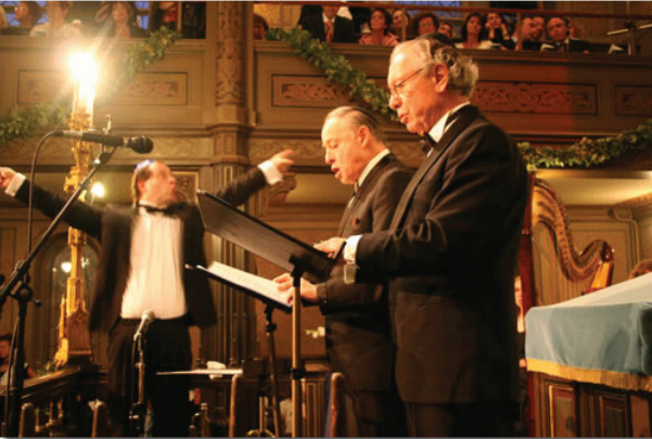
S.H opus 107 för 3 tenorer, 2 köror och orkester. Här uruppförande vid Göteborgs Synagogas 150 årsfirande.