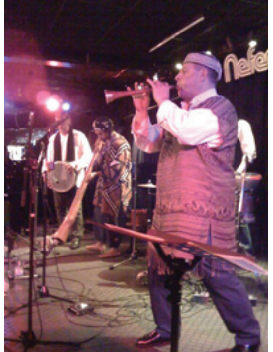
ZEBRA SYNDICATE - samlingsnamnet för: Jewish-Islamic-Christian-Artists