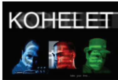
Musikdramatisk verk Kohelet, Ordspråksboken på hebreiska.