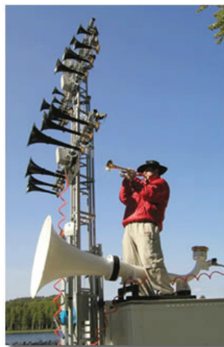
Världens ljudstarkaste mobila musikinstrument: TyfonOrgeln. 19 båt-tutor. Den enda i sitt slag. För speciella utomhusevenemang