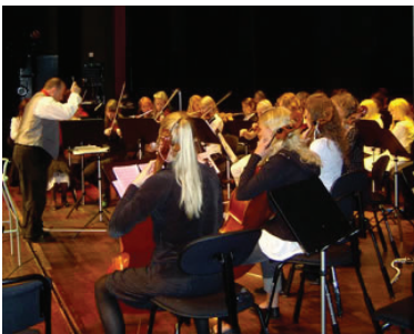
Klezmerprojekt för kultur och Musikskolor.